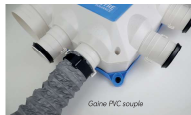
Gaine PVC souple