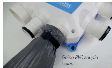
Gaine PVC souple isolée