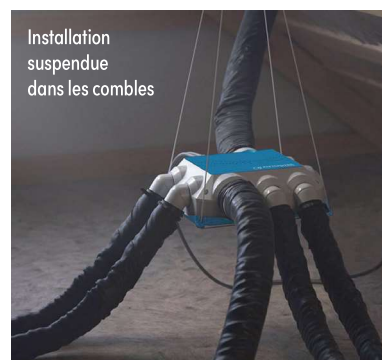
Installation suspendue dans les combles