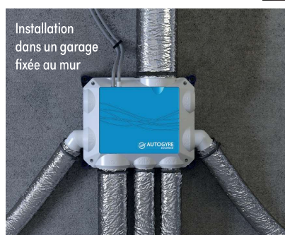
Installation dans un garage fixée au mur

Le collier «Quick'Gaine» assure le maintien des gaines sans outil.