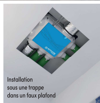
Installation sous une trappe dans un faux plafond