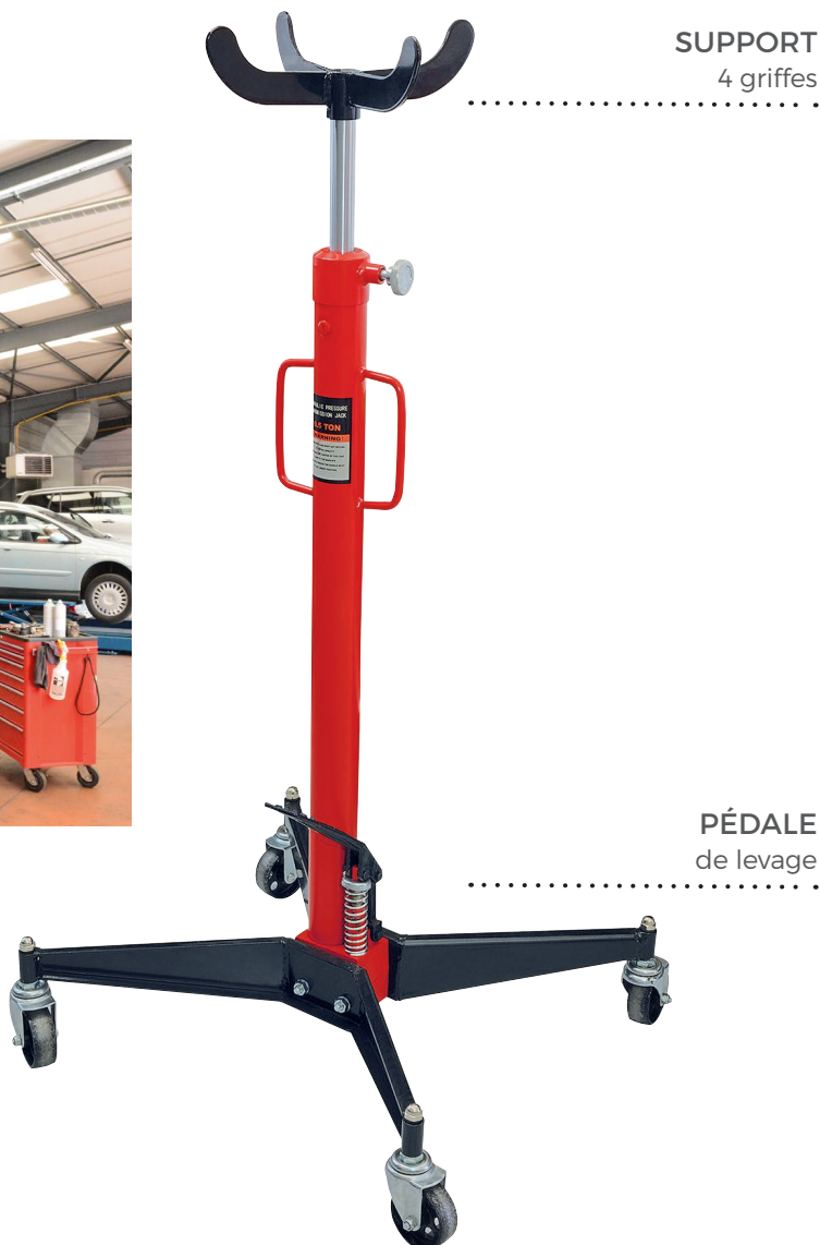
SUPPORT 4 griffes