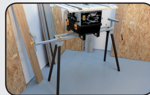
Support de scie de table Table saw stand