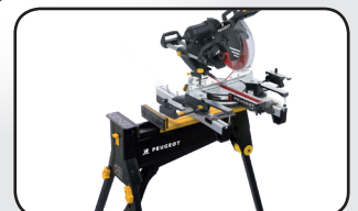
Support de scie à onglet Mitre saw stand