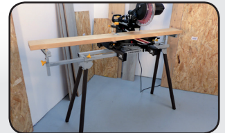
Support de scie à onglet Mitre saw stand