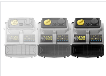
Clipsable en série Serial clip on