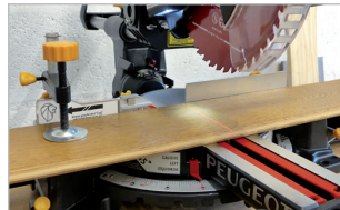
Laser + éclairage LED + 2 extensions avec butées Laser + LED light + 2 extensions with stop gauge