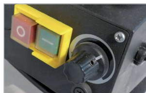
Variateur de vitesse (500-1700 tr/min) Speed variator (500-1700 tr/min)