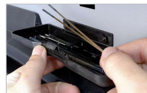
Compartment de stockage des lames Compartment for blade storage