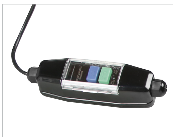
Prise de protection contre les surtensions PRCD socket