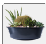
Bac à plantes amovible (prof. 20 cm)