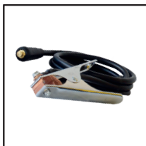
Pince de masse