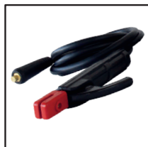
Pince porte électrode