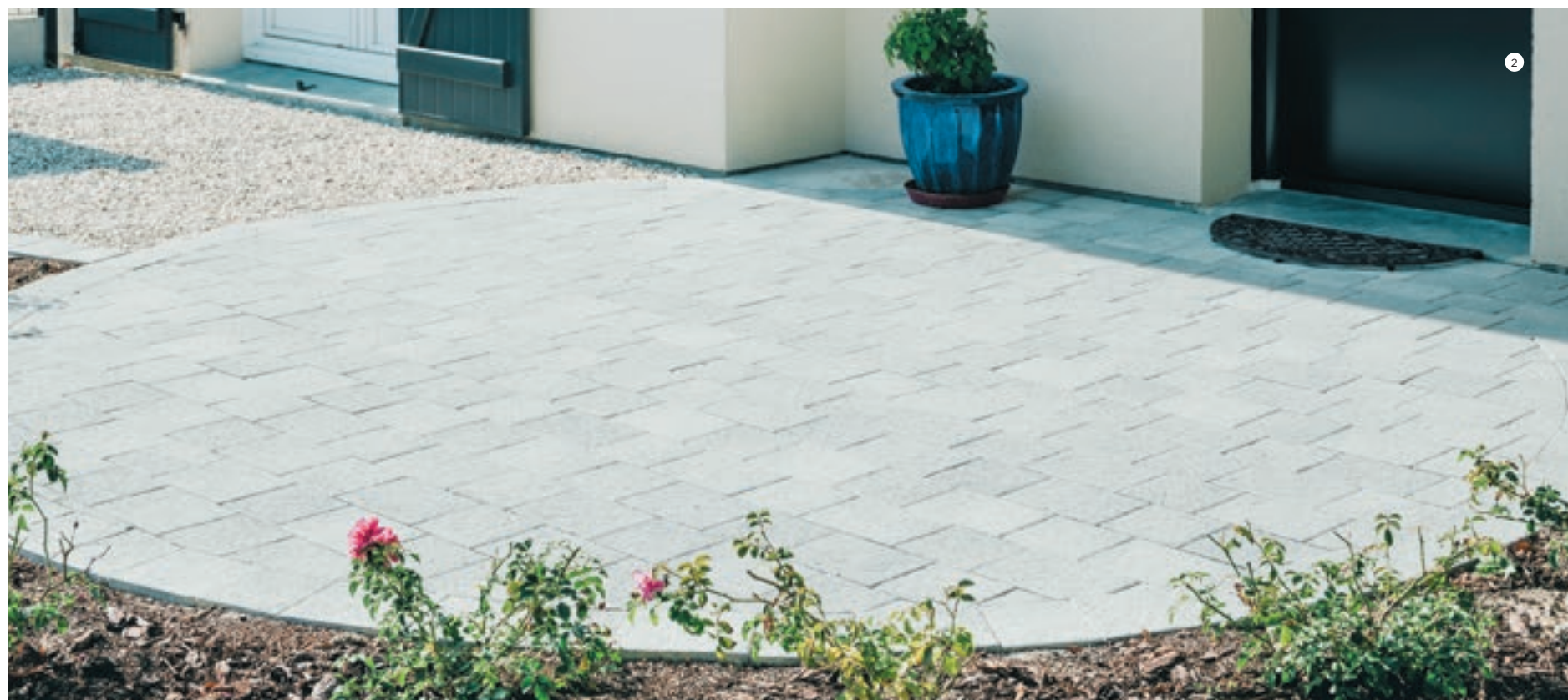
2 Pavé Montréal, finition grenaillé brossé, teinte Gris nuancé

Classe de trafic T5 : admet la circulation de véhicules (charge totale \geq 3,5 T) dans la limite de 25 véhicules par jour et sens. Respecter la pose sur sable ou sable stabilisé.