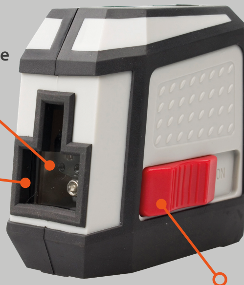
Bouton d'arrêt du niveau laser