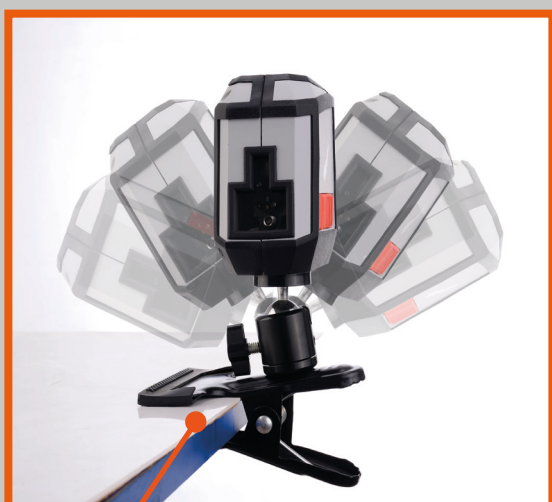
Support pince de fixation pour niveau laser