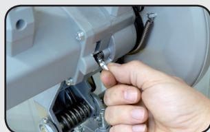
Blocage de l'arbre du disque Disc spindle locking