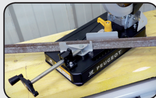
Etau réglable 45° Vise setting 45°