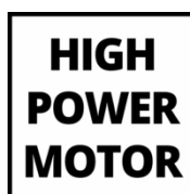
HIGH POWER MOTOR