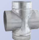
Croix Ø 125 mm