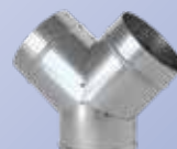
Y Ø 125 mm