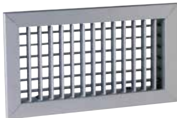
SC102D F3 400X150

La grille murale en acier SC 102 D permet la reprise d'air dans un local pour des installations de ventilation ou de conditionnement d'air.