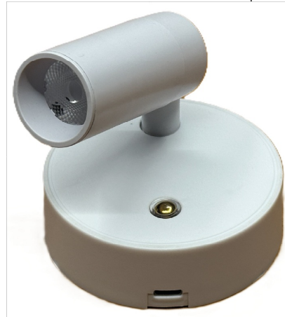
USB C 5V-1A

Installez le luminaire sur la surface métallique